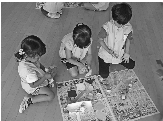
たなぼたかざり☆☆☆ さんかくつなぎ、みんなでつくろう！