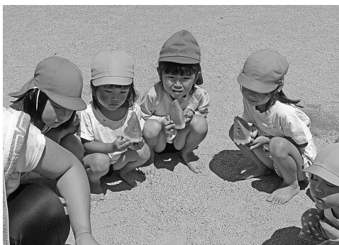
スイカ割りしたよ。おいしいね。