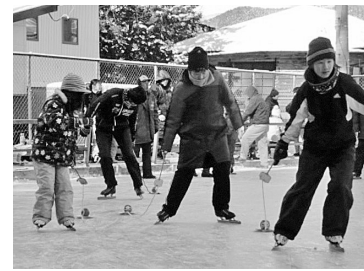
下駄スケート体験