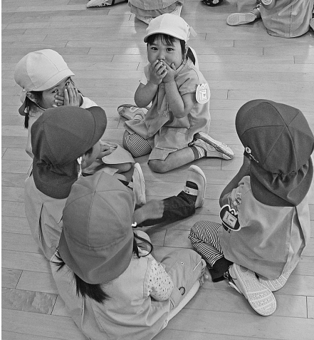
わらべうたあそび、 たのしいね☆

おにいさん、おねえさんと一緒に絵を描いたり、わらべうたあそびをしたりして、毎日楽しく遊んでいます。ペアでの活動を楽しんでいます。