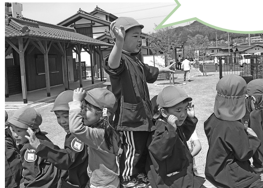
よいさ館は保育園のご近所だよ。 みんなで御柱に乗って「よいさ！よいさ！」